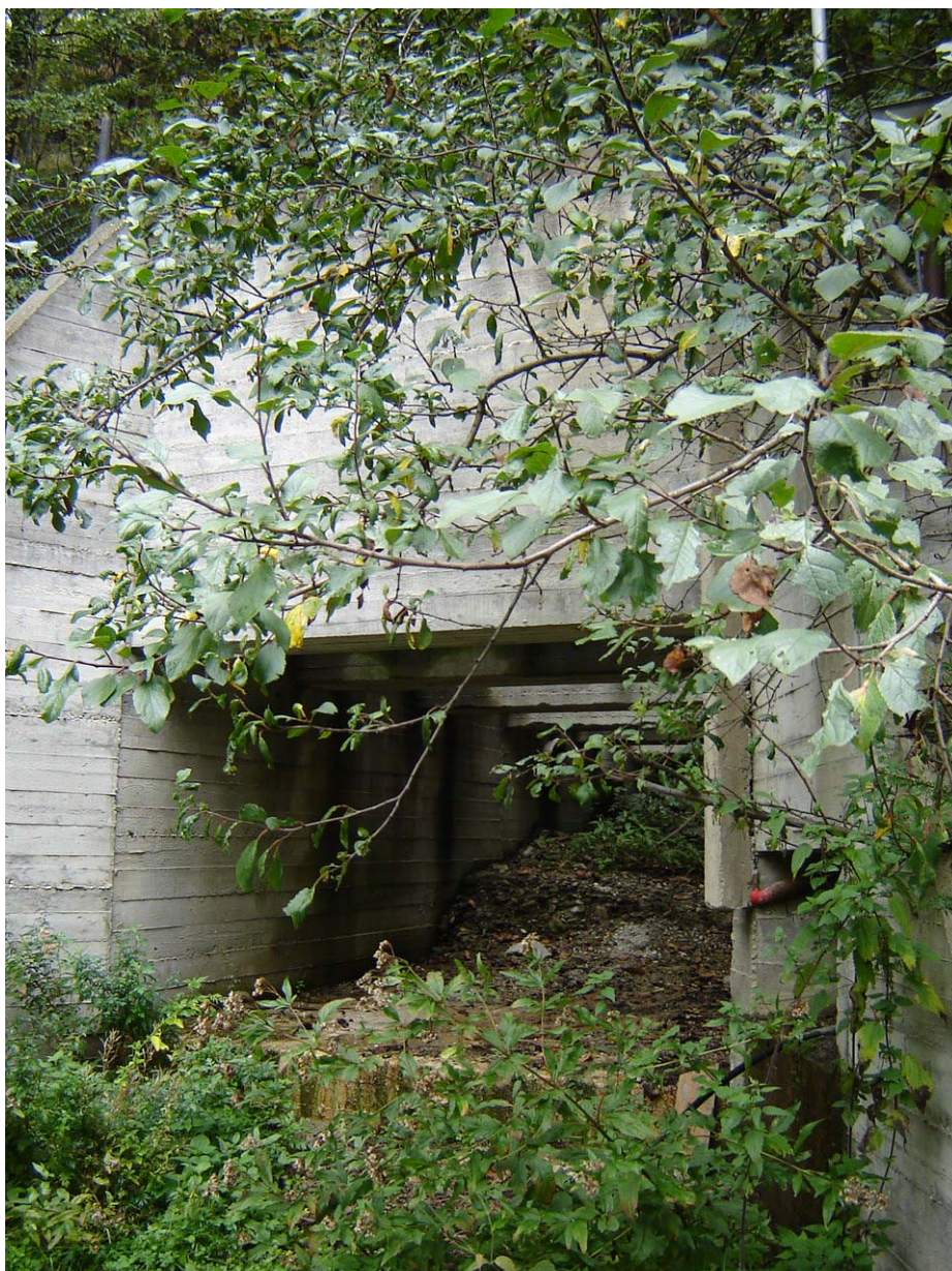
Foto 004 – Opera BATTAG004 . Ripresa da valle, sponda sinistra del rio affluente sinistro del T. Germanasca.