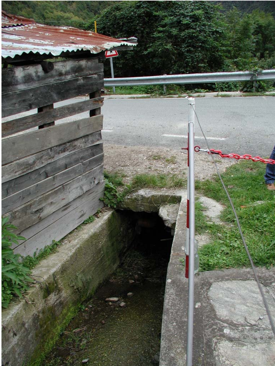
Foto 001 – Opera TREVAG001 . Foto scattata da monte verso valle. Affluente del T. Germanasca.