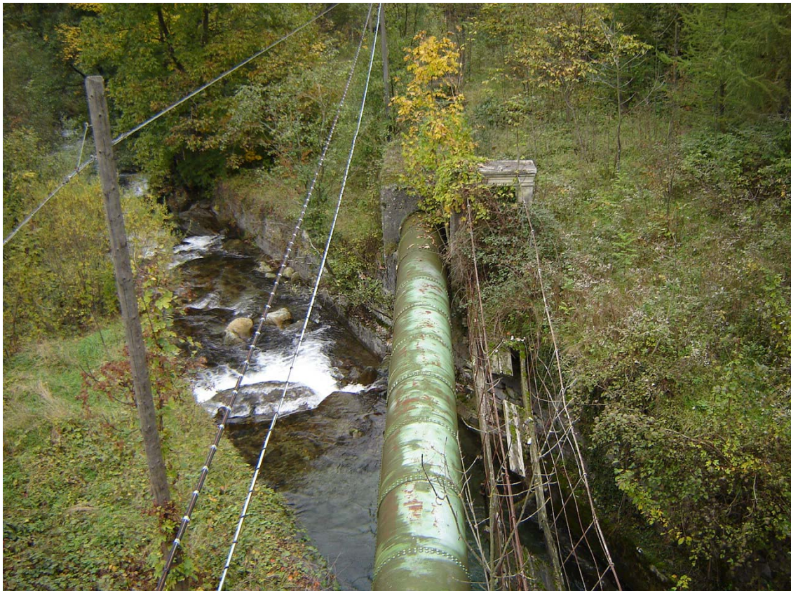
Foto 011 – Opera BATTDS011 . Ripresa da monte, dall'opera BATTPO012.