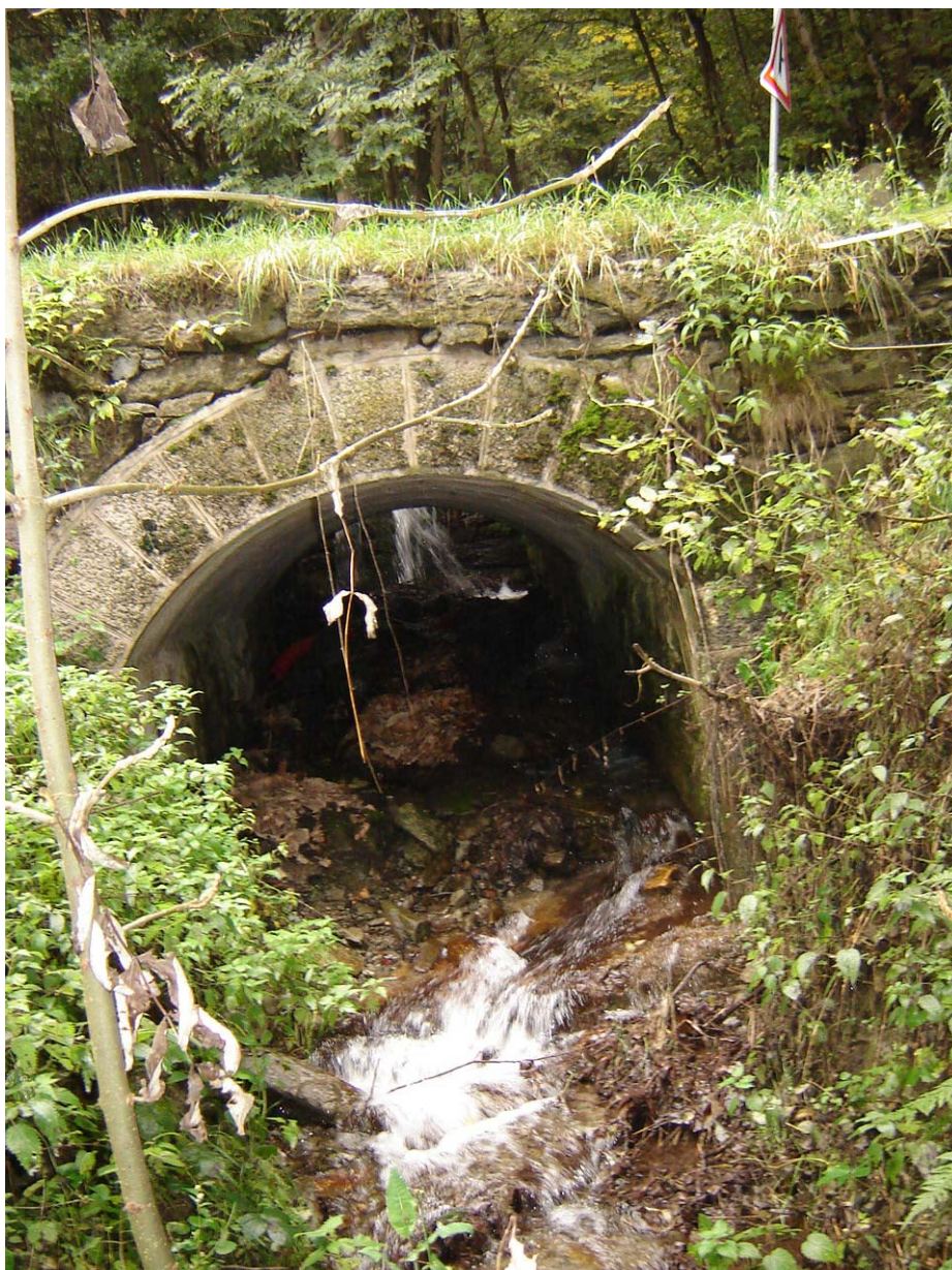
Foto 003 – Opera BATTAG003 . Ripresa da valle, sponda destra del rio affluente sinistro del T. Germanasca di Massello.