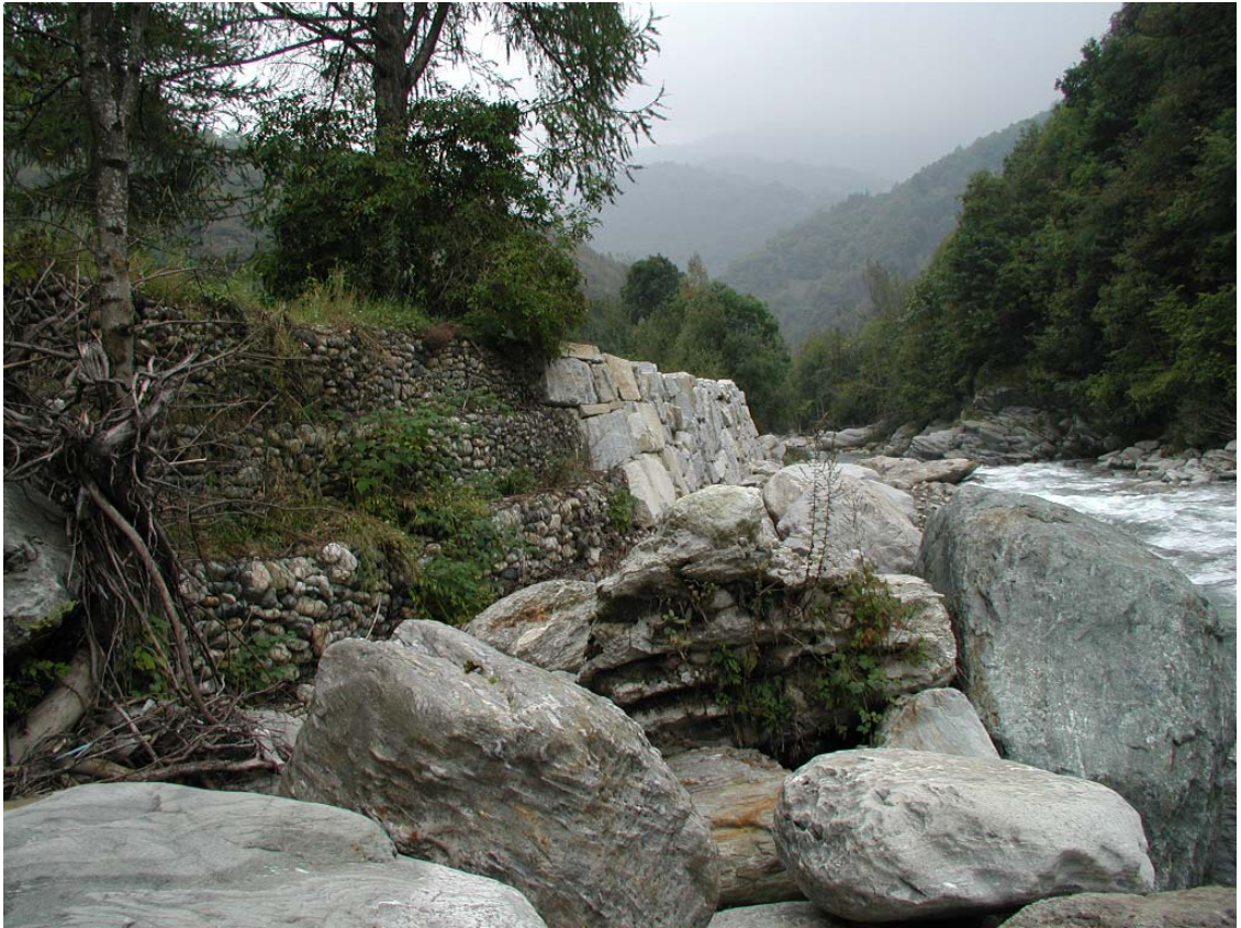
Foto 003 – Opera BATTD003 . Foto scattata da monte verso valle, in sponda sinistra del T. Germanasca.