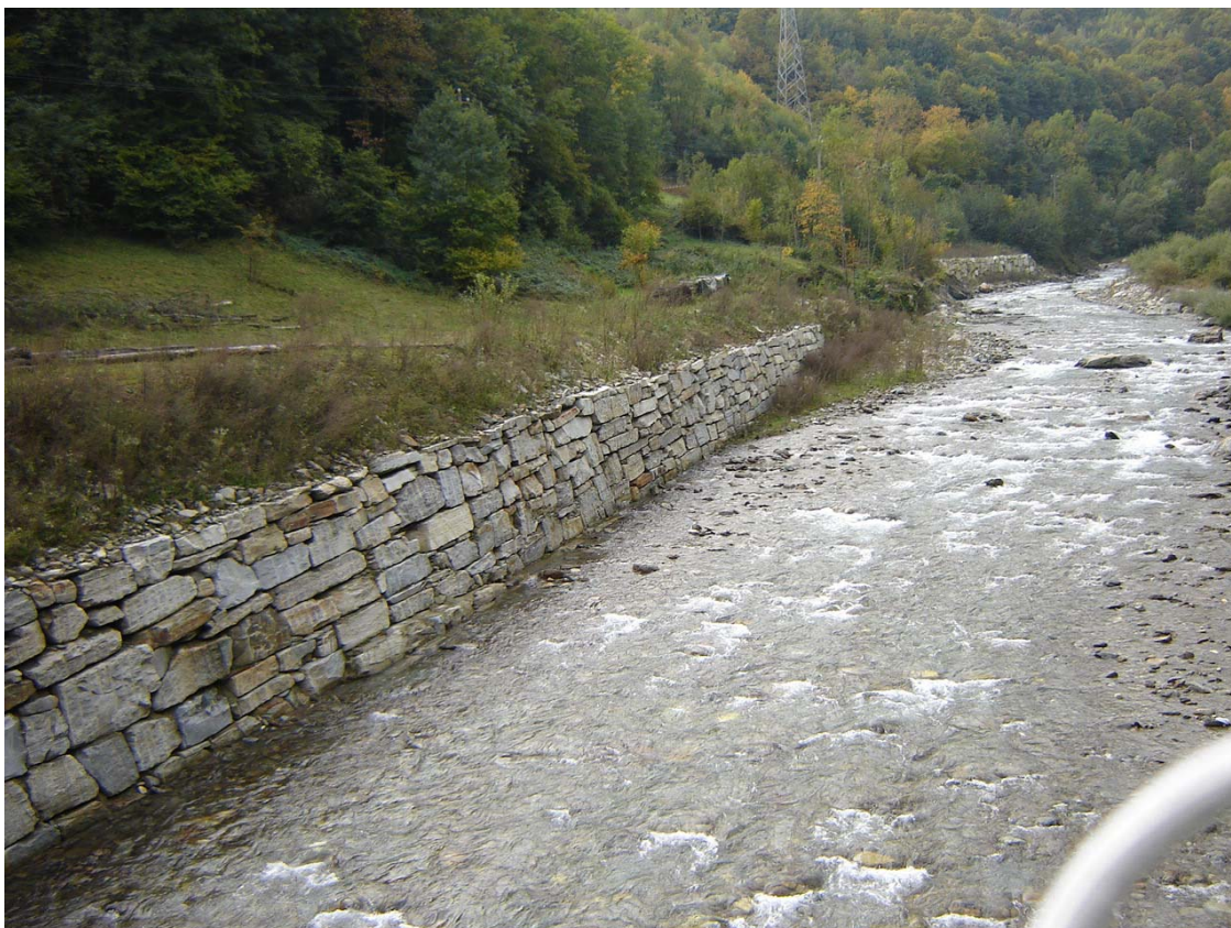
Foto 009 – Opera BATTDS009 . Ripresa da valle, dall'opera BATTPO008.