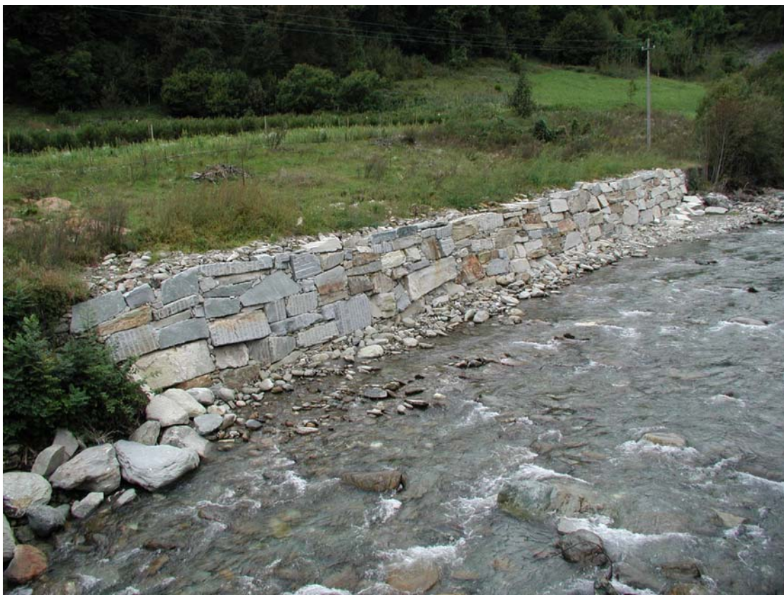
Foto 007 – Opera TREVDS007 . Foto scattata da valle verso monte, in sponda destra del T. Germanasca.