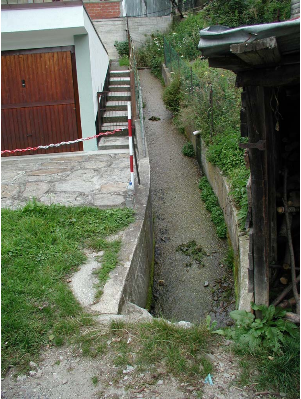
Foto 001 – Opera BATTCA001 . Foto scattata da valle varso monte. Affluente del T. Germanasca.