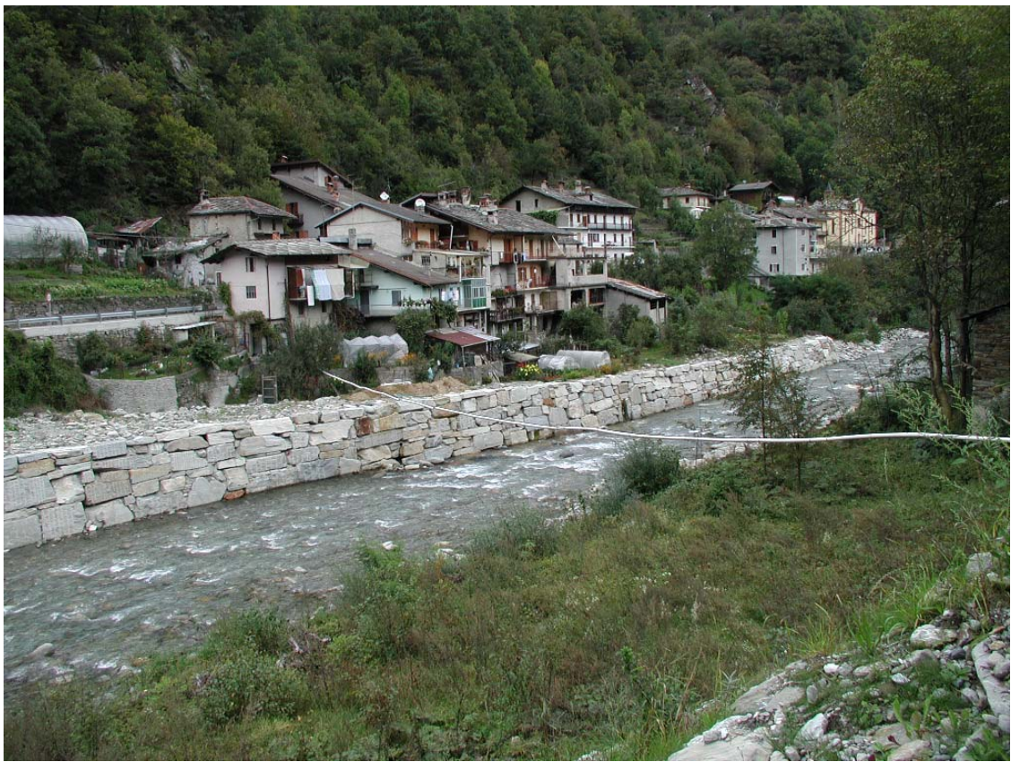
Foto 005 – Opera TREVDS005 . Foto scattata da monte verso valle, in sponda destra del T. Germanasca.