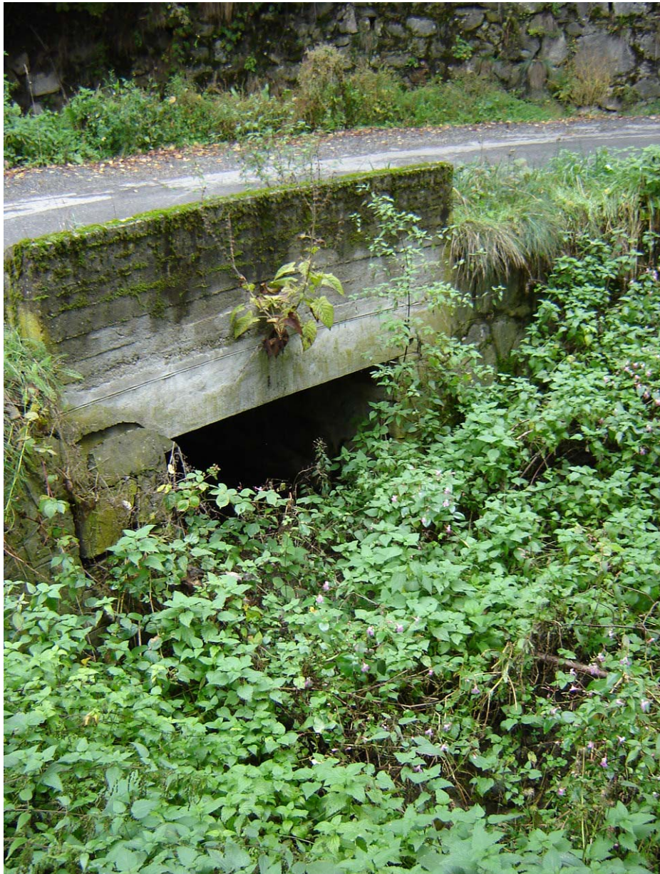
Foto 005 – Opera BATTAG005 . Ripresa da valle, sponda sinistra del rio affluente sinistro del T. Germanasca.