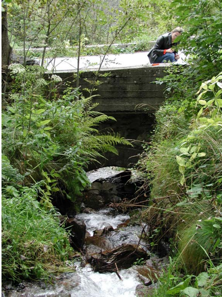
Foto 002 – Opera BATTAG002 . Foto scattata da monte verso valle. Affluente del T. Germanasca.