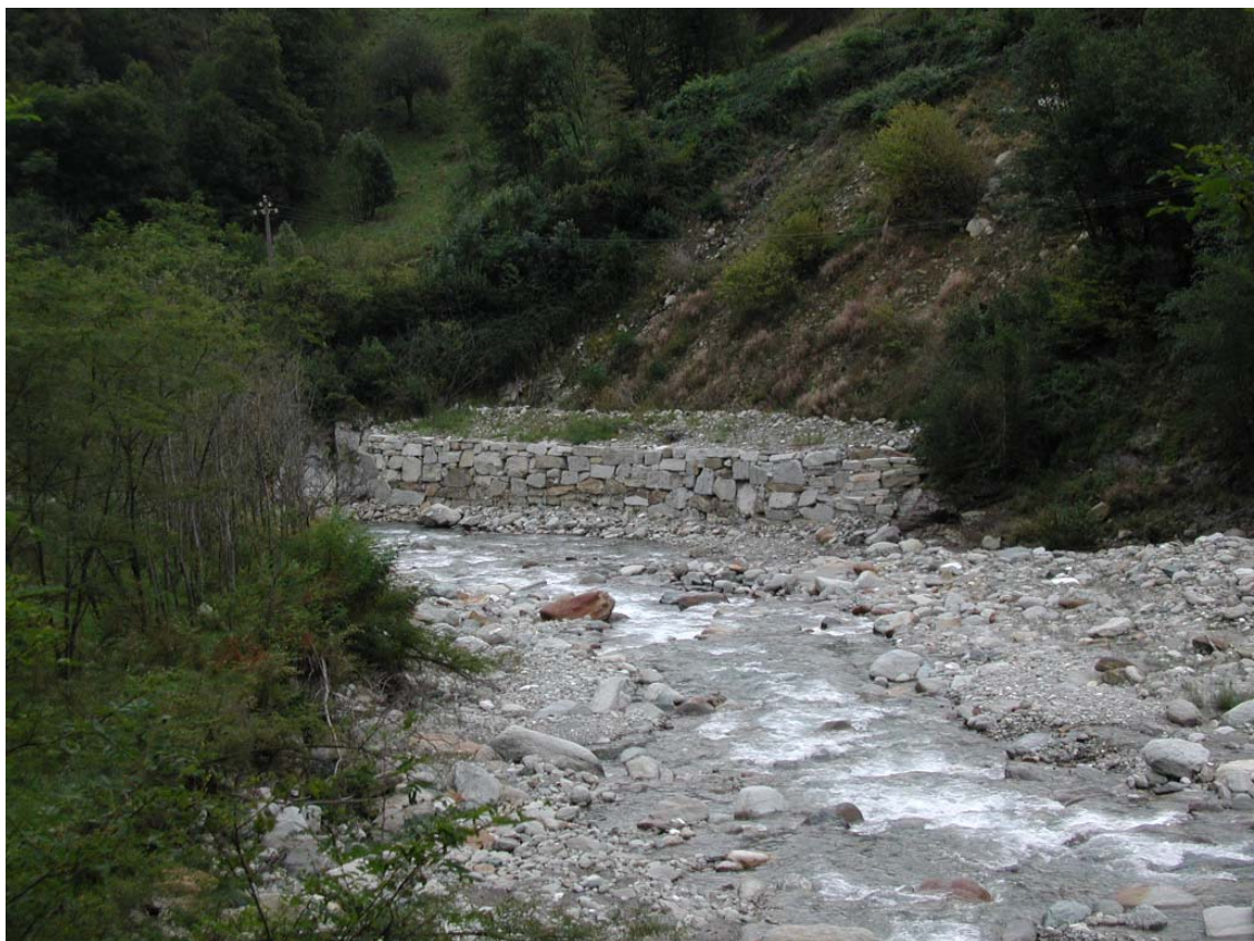
Foto 006 – Opera BATTDS006 . Foto scattata da valle verso monte, in sponda destra del T. Germanasca.