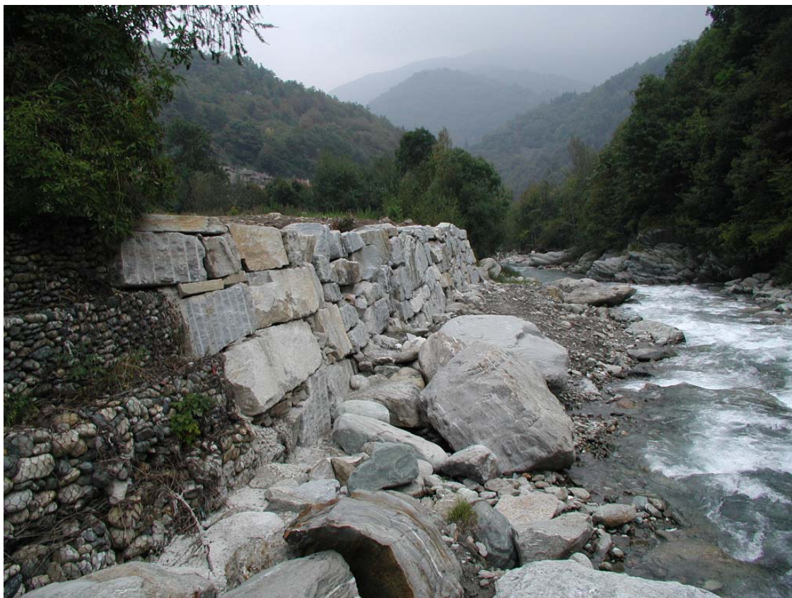
Foto 001 – Opera BATTDS001 . Foto scattata da valle verso monte, in sponda sinistra del T. Germanasca.