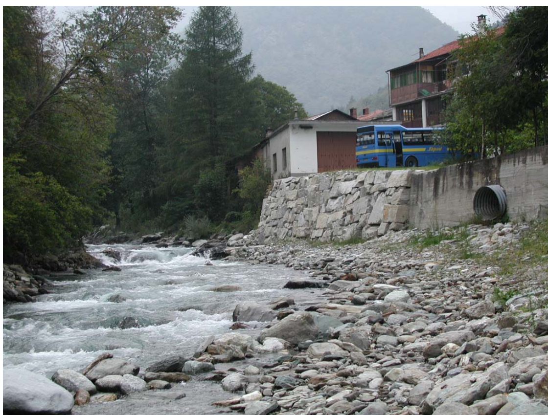
Foto 002 – Opera TREVDS002 . Foto scattata da valle verso monte, in sponda sinistra del T. Germanasca.