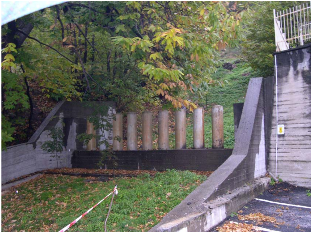
Foto 001 – Opera BATTBR001 . Ripresa da valle, sponda sinistra dell'affl. del T. Germanasca.