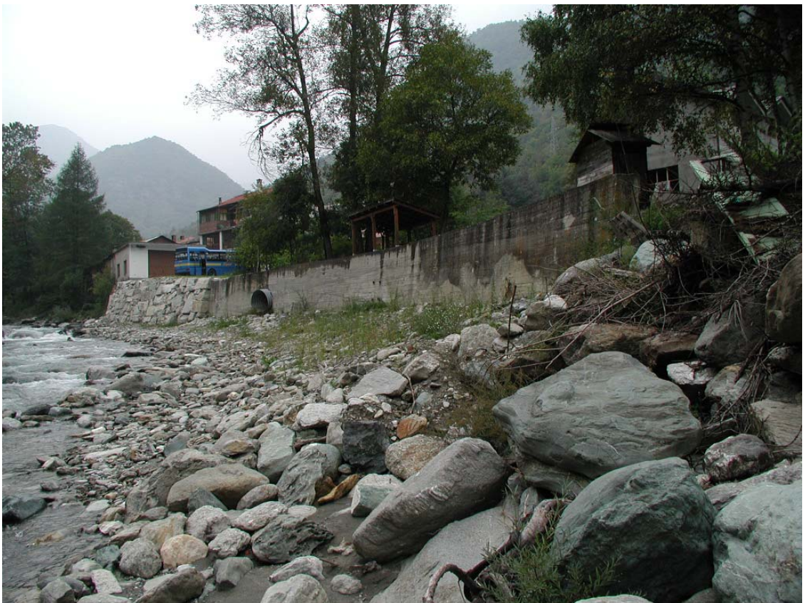
Foto 004 – Opera TREVDS004 . Foto scattata da valle verso monte, in sponda sinistra del T. Germanasca.