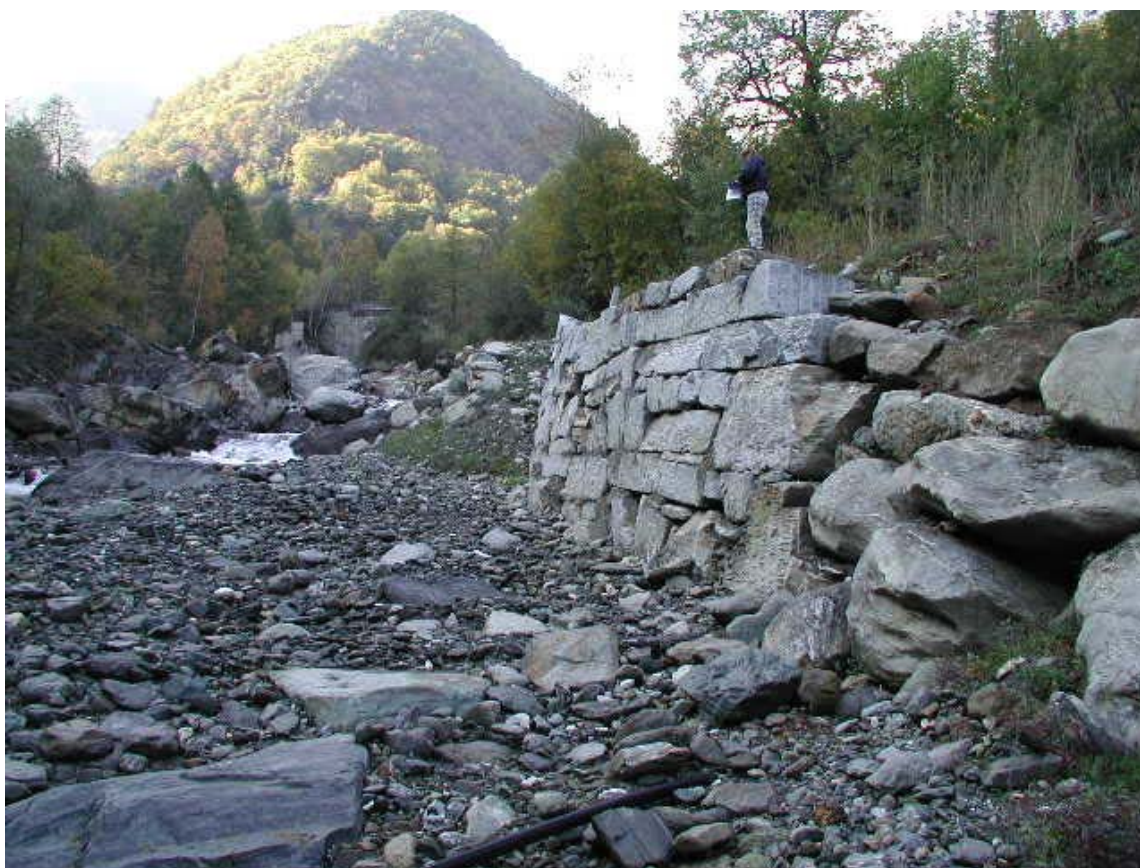
Foto 008 – Opera CANADS008 . Ripresa da valle, in alveo del T. Germanasca.