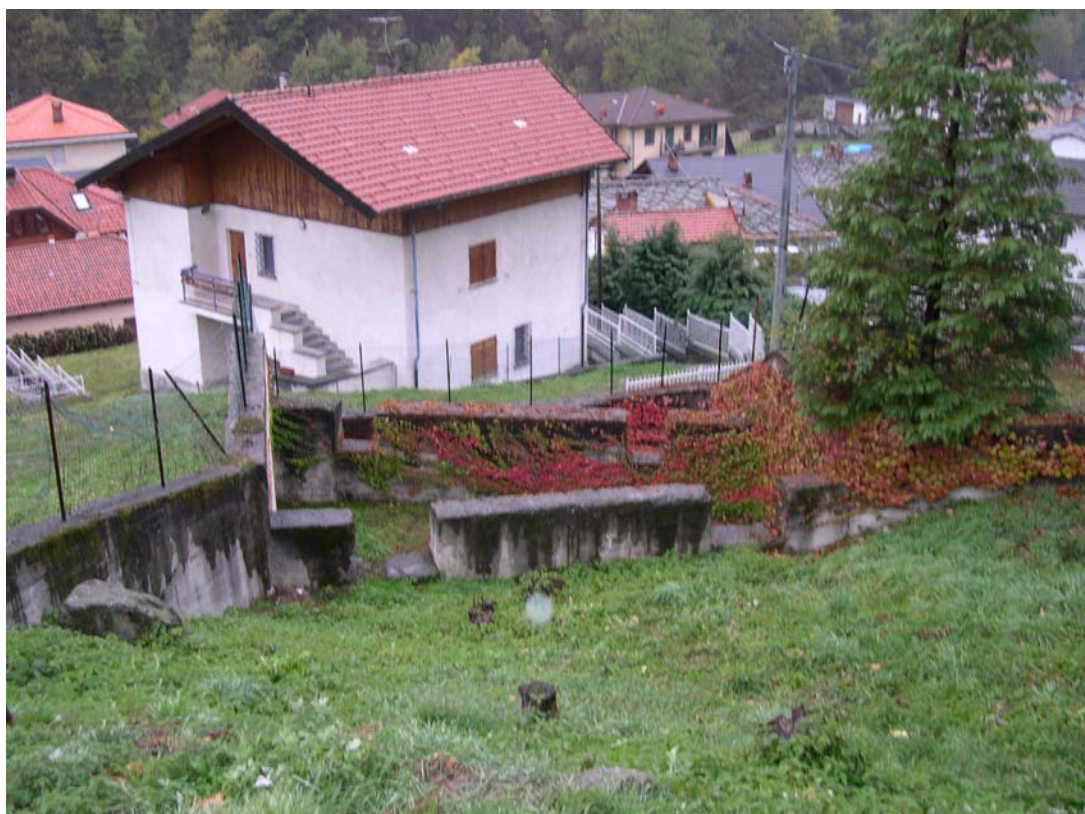
Foto 002 – Opere BELTBR002 e BATTBR003 . Ripresa da monte, dall'alveo dell'affl. del T. Germanasca.