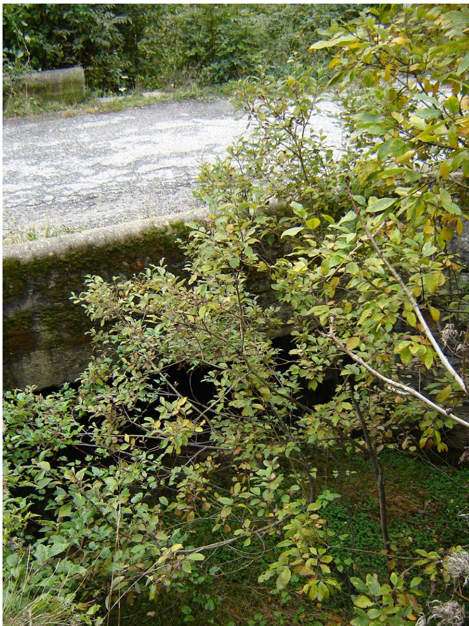
Foto 006 – Opera BATTAG006 . Ripresa da monte, sponda sinistra del rio affluente sinistro del T. Germanasca.