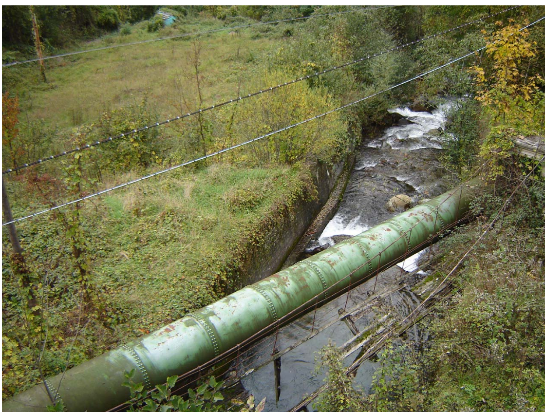
Foto 010 – Opera BATTDS010 . Ripresa da monte, dall'opera BATTPO012.