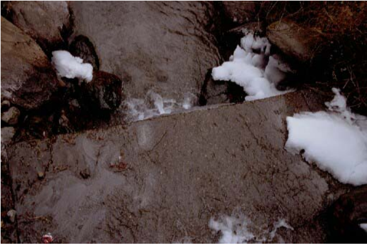
Foto 001 – Opera CANASO001 . Ripresa da monte, dal ponte CANAPO003.