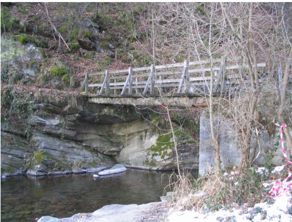
Foto 024 – Opera PENNAG024 . Ripresa da valle, sponda sinistra del R. Risagliardo.