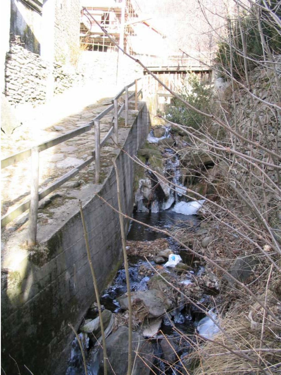
Foto 011 – Opera CANADS011 . Ripresa da valle, dall'attraversamento TREVAG014 .