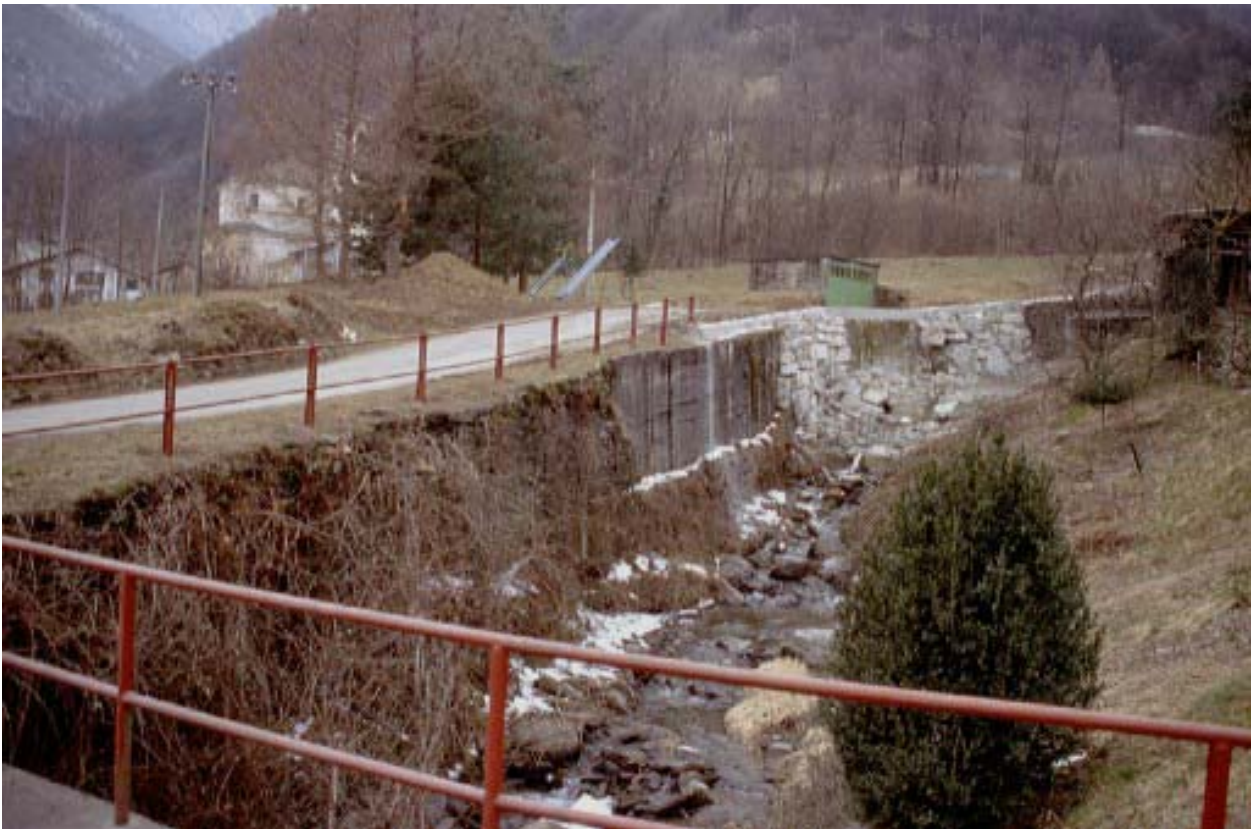
Foto 002 – Opera TREVDS002 . Ripresa da valle, dal ponte TREVPO002.