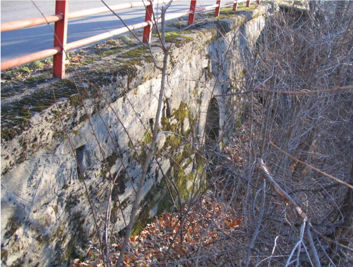
Foto 022 – Opera PENNAG022 . Ripresa laterale lungo la strada per Pellenchi.