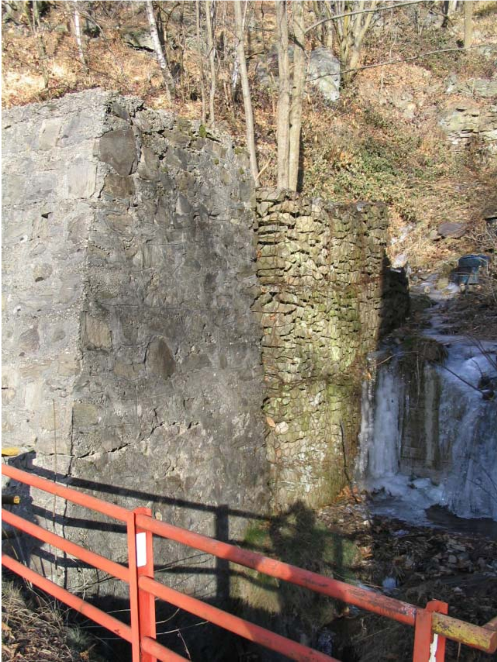
Foto 014 – Opera BATTDS014 . Ripresa dall'attraversamento CANAAG011