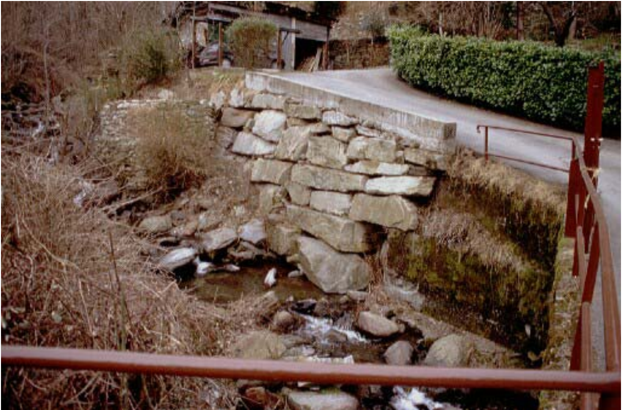
Foto 003 – Opera CANADS003 . Ripresa da valle, in corrispondenza del ponte CANAPO003.