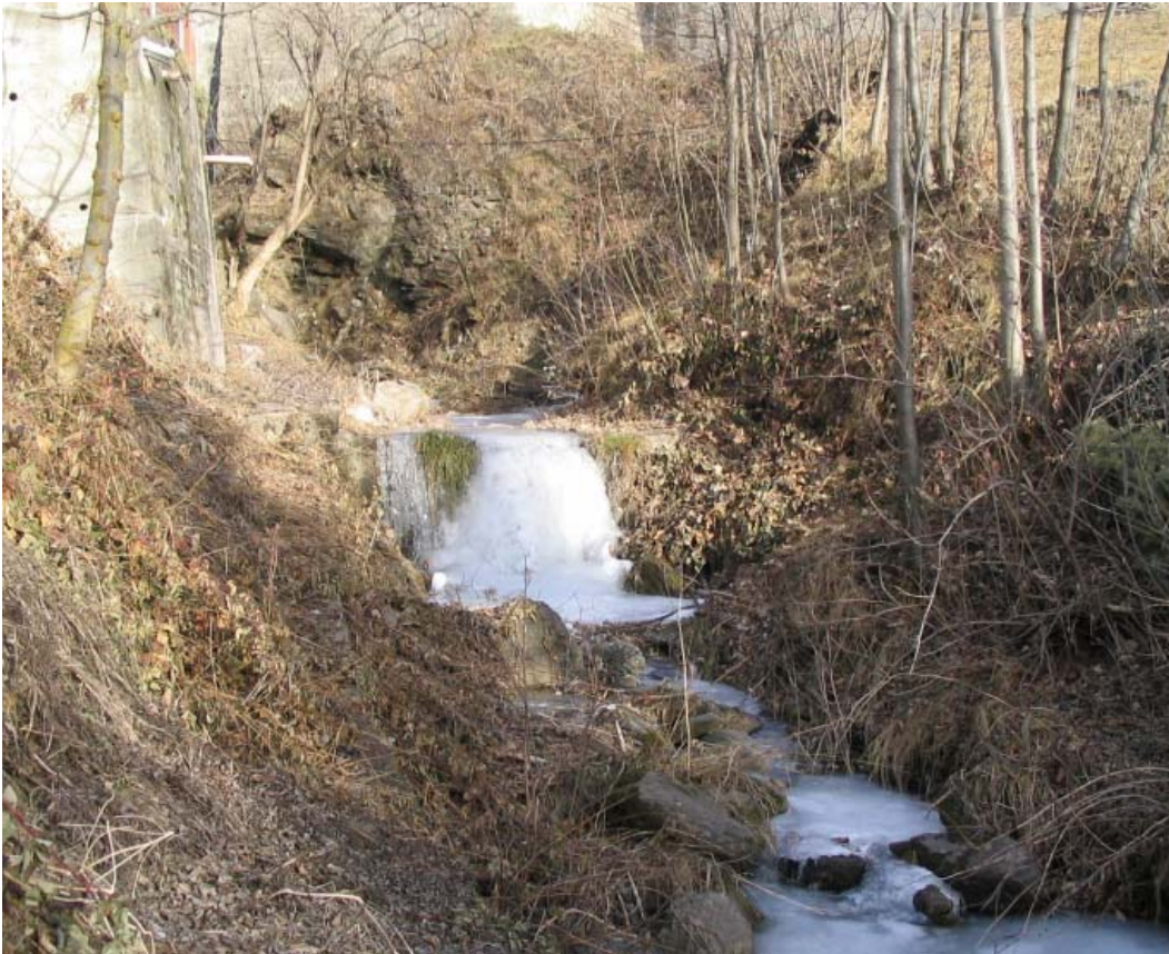
Foto 008 – Opera CANASO008 . Ripresa da valle, lungo l'incisione.