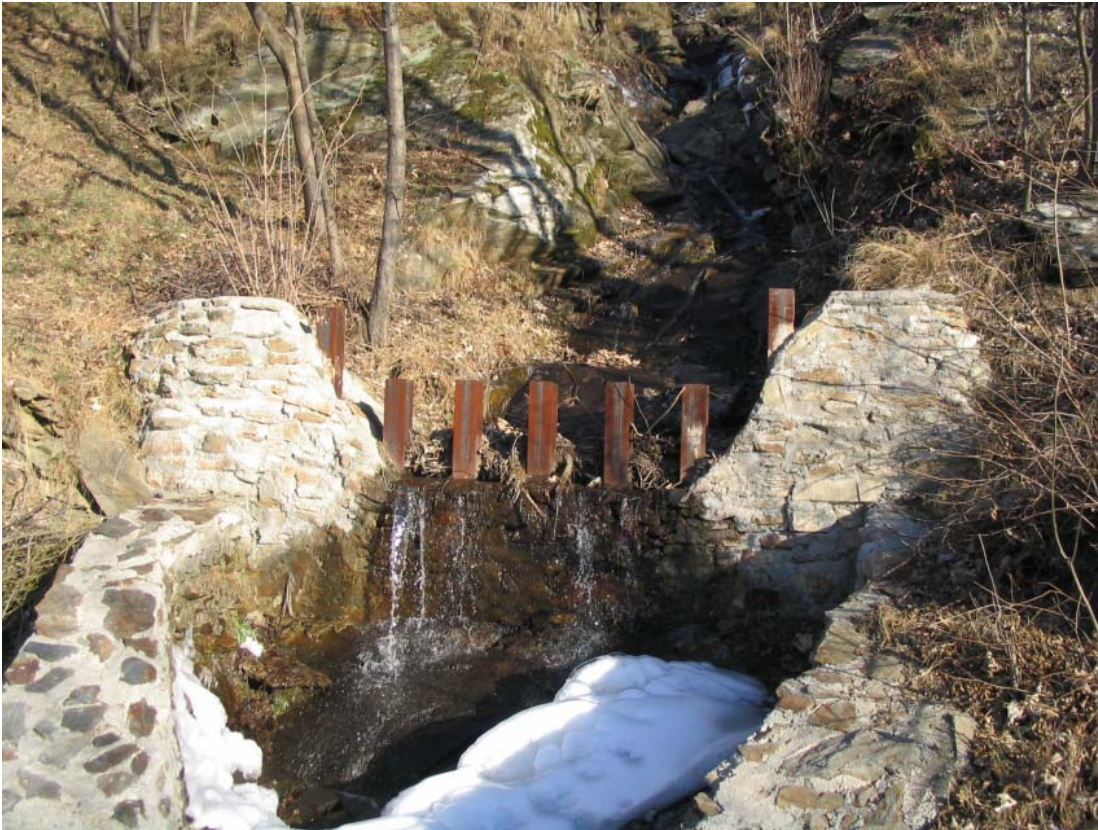
Foto 005 – Opera CANABR005 . Ripresa da valle, dall'attraversamento CANAAG017 .