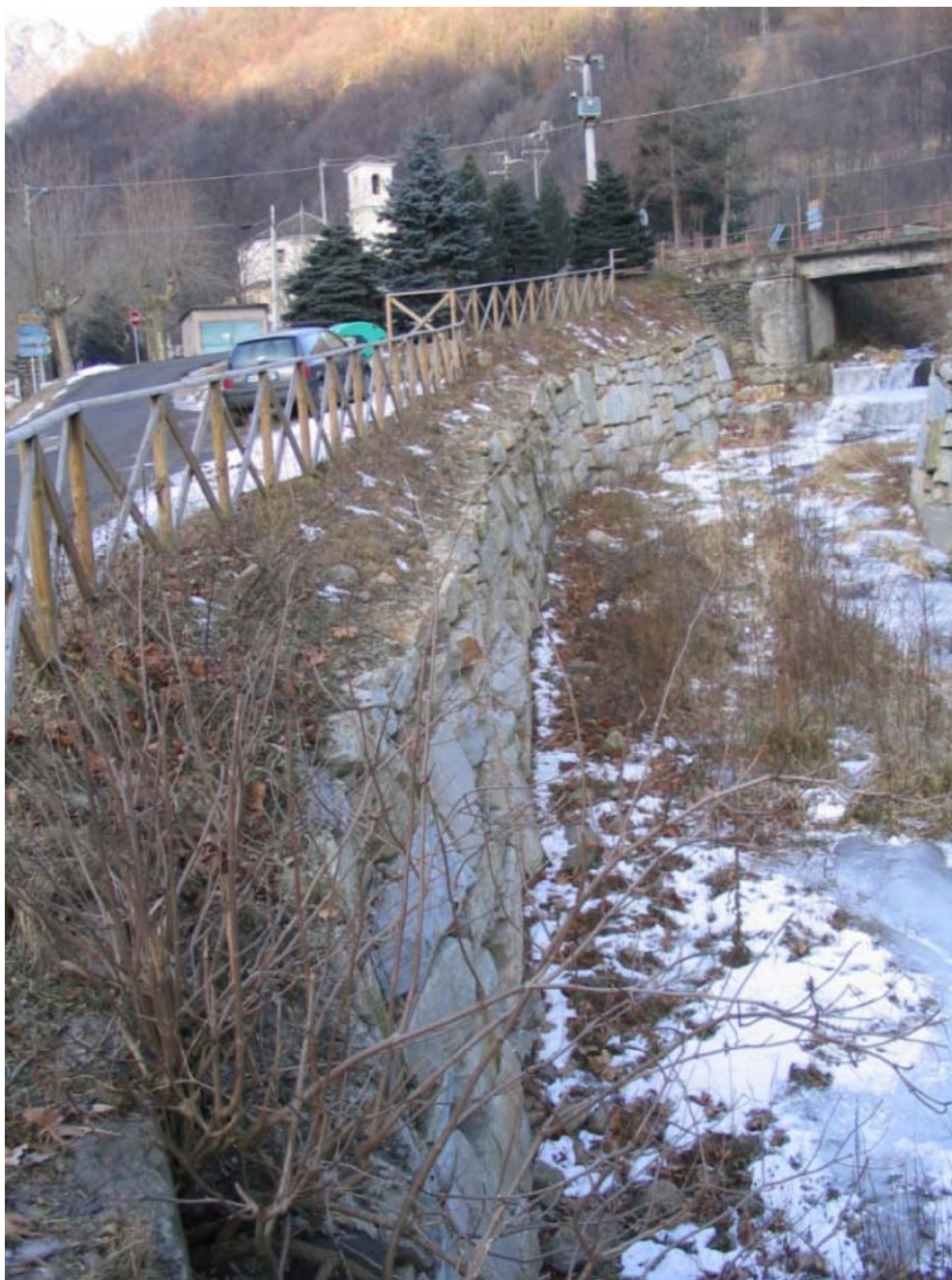
Foto 009 – Opera CANADS009 . Ripresa da valle, dal ponte CANAPO001.