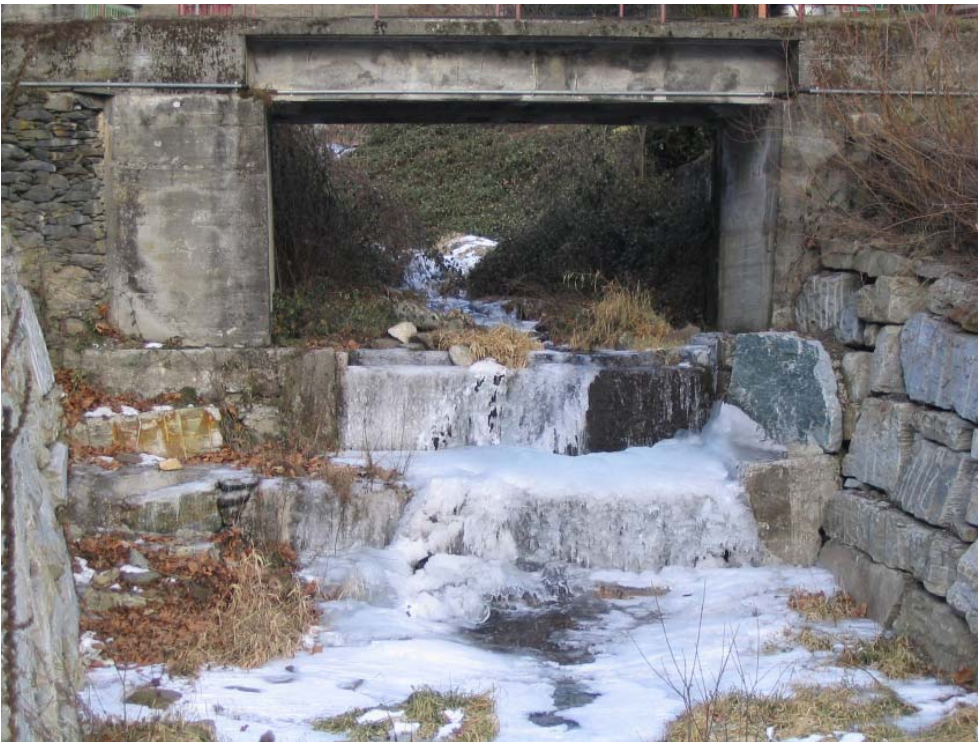
Foto 004 – Opera TREVS0004 . Ripresa da valle, sponda destra del rio.