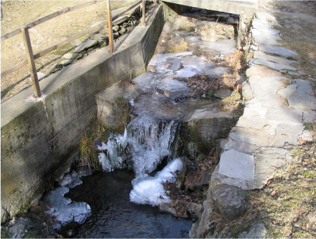
Foto 007 – Opera CANASO007 . Ripresa da valle, dalla difesa TREVDS012.