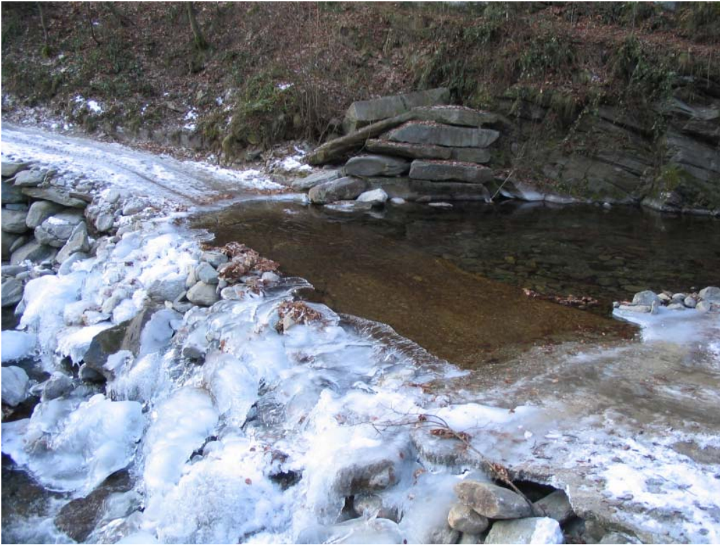
Foto 009 – Opera BATTSO009 . Ripresa laterale, sponda sinistra del R. Risagliardo.