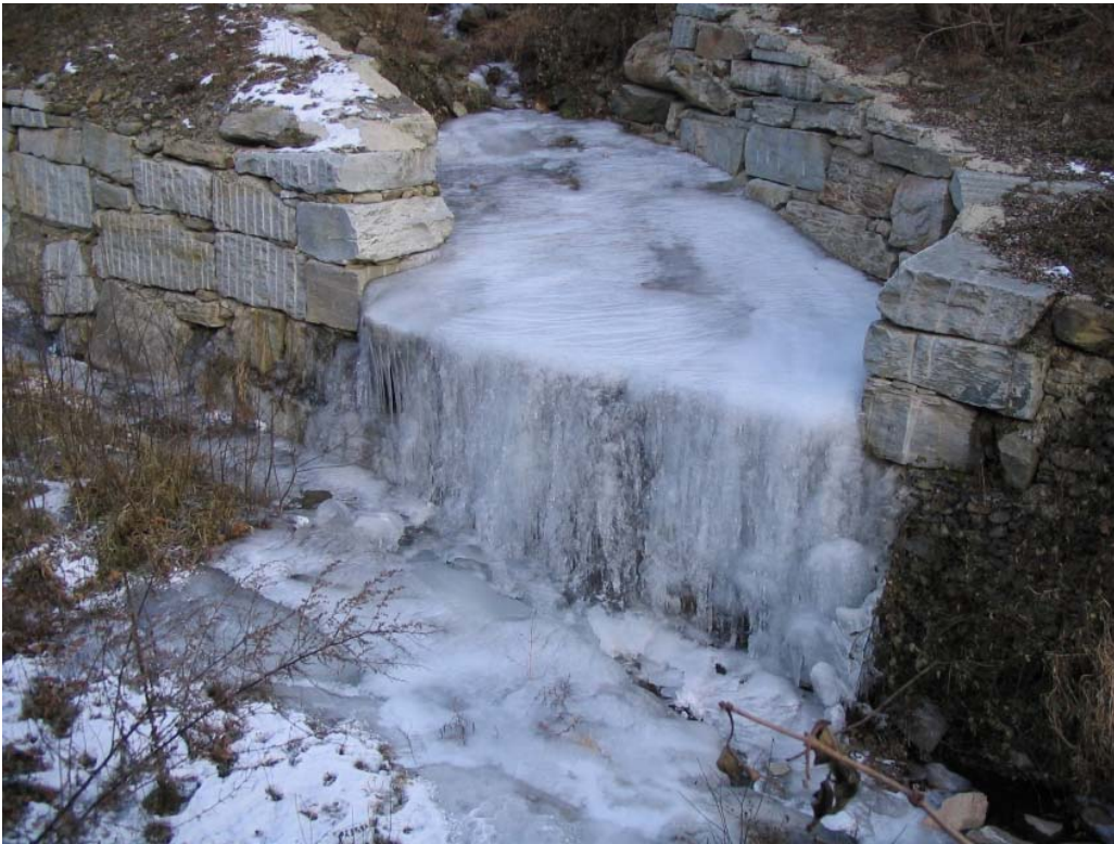
Foto 005 – Opera CANASO005 . Ripresa frontale dal ponte CANAPO001 .