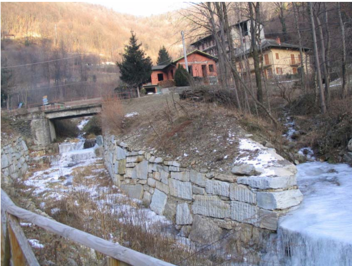
Foto 008 – Opera TREVDS008 . Ripresa da valle, dal ponte CANAPO001.