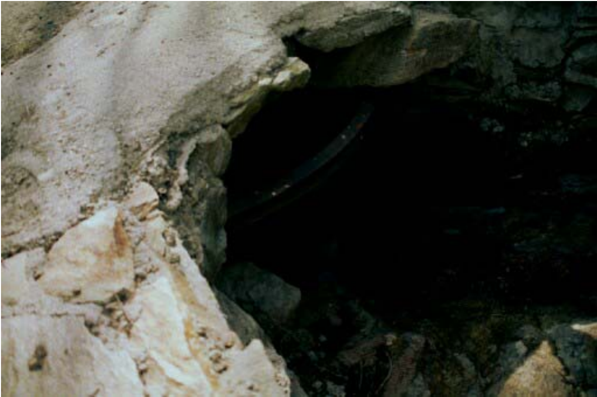
Fot 017 – Opera CANAAG017 . Ripresa da monte.