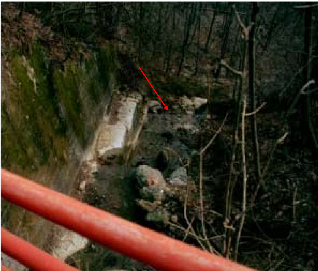
Foto 006 – Opera TREVS006 . Ripresa da monte, dall'attraversamento TREVAG010 .