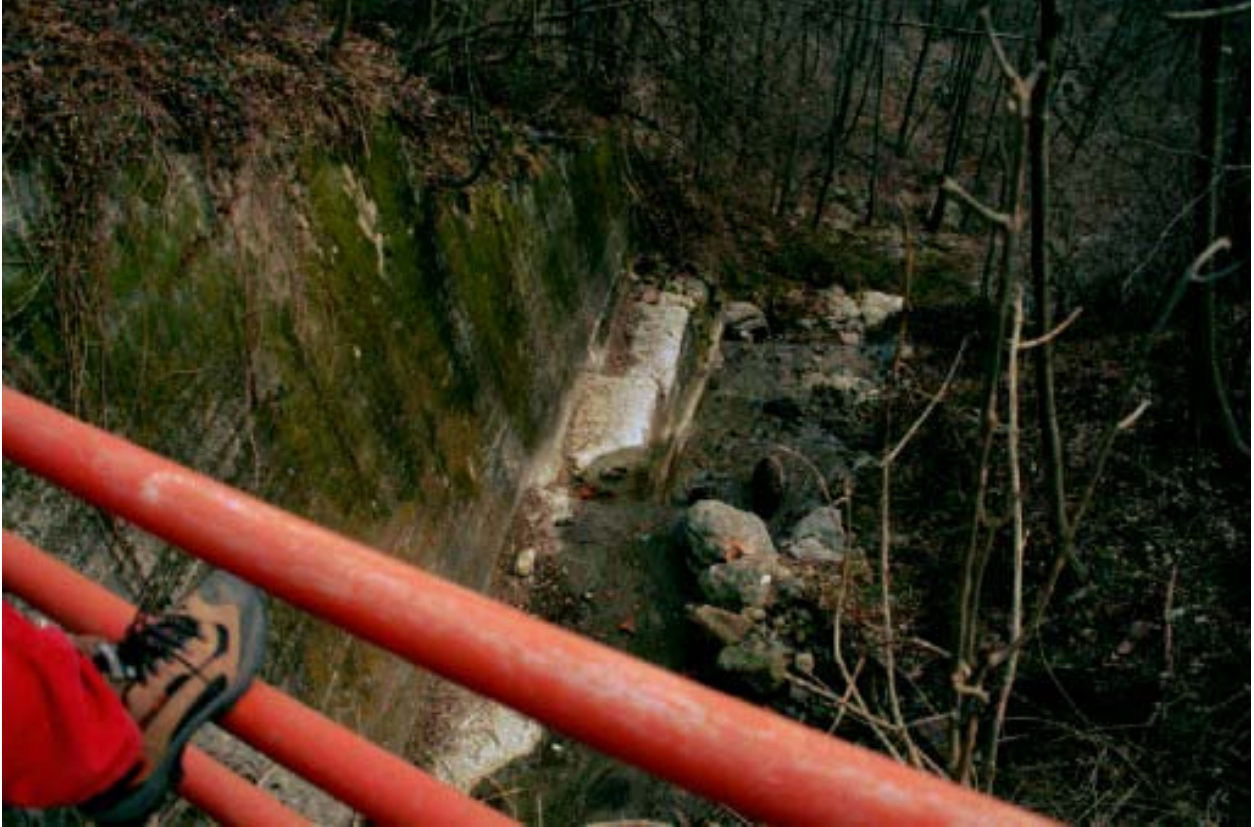
Foto 010 – Opera TREVDS010 . Ripresa da monte, dall'attraversamento CANAAG011 .