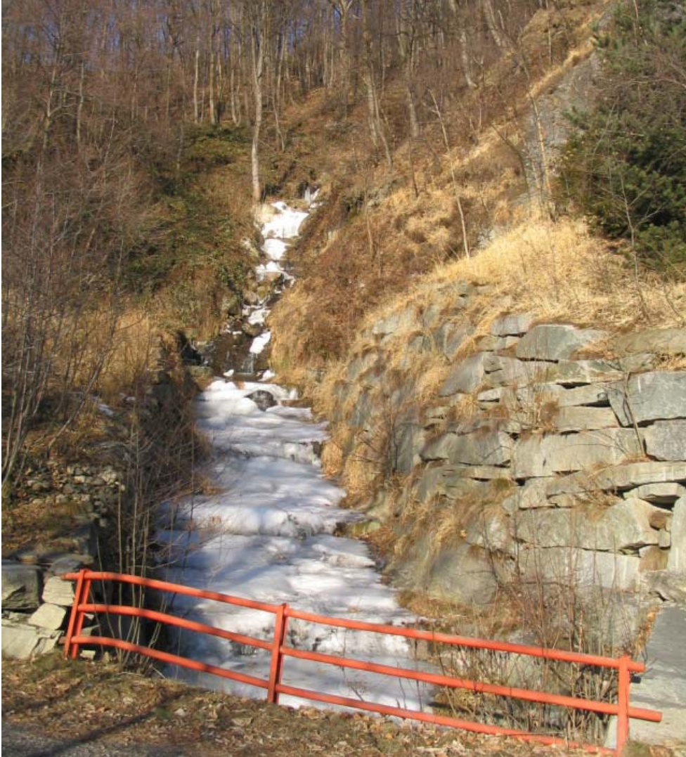
Foto 002 – Opera PENNCA002 . Ripresa da valle, dall'attraversamento TREVAG010 .