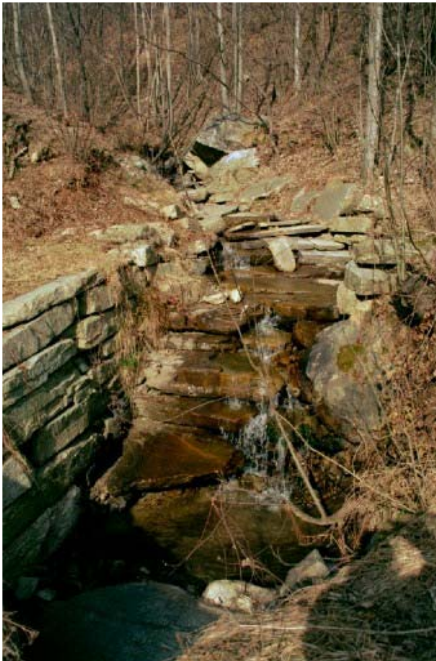
Foto 001 - Opera CANACA001 . Ripresa da valle.