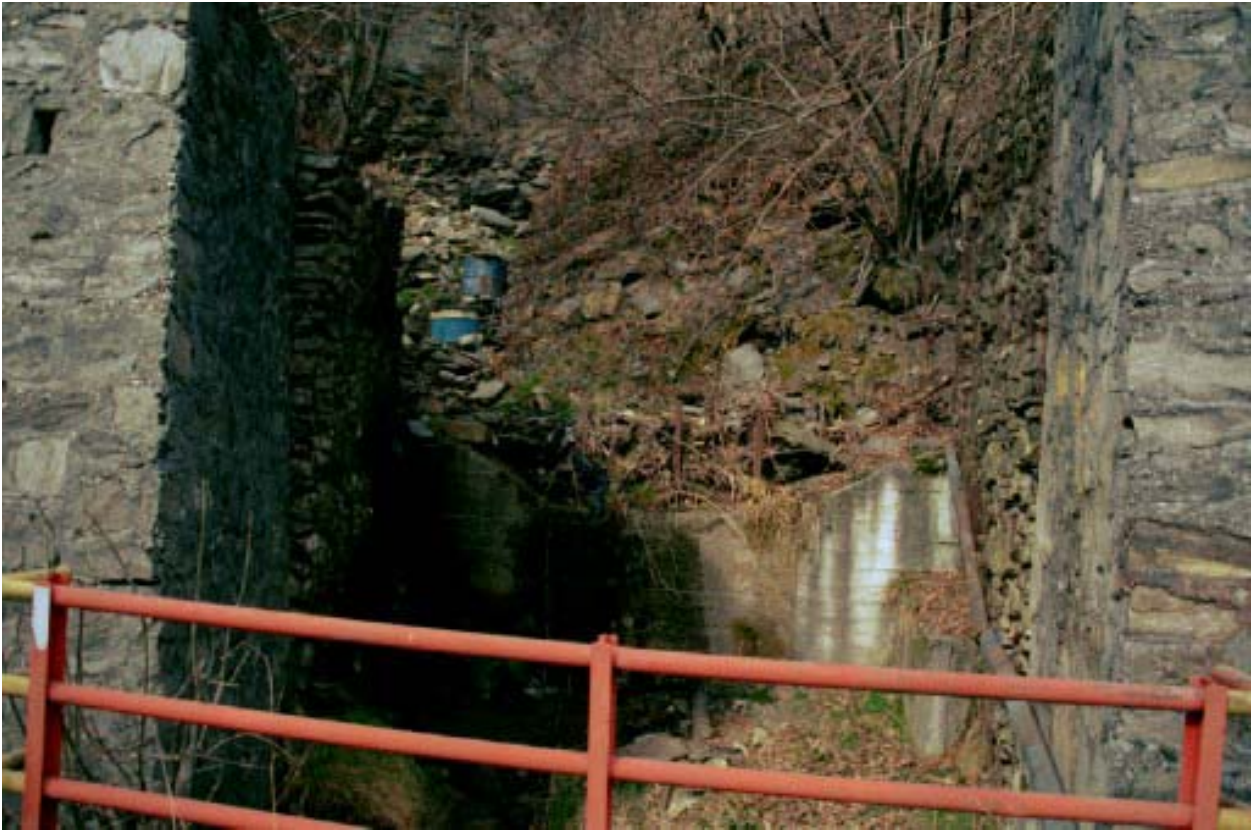
Foto 001 – Opera CANABR001 . Ripresa da valle, dall'attraversamento CANAAG011.