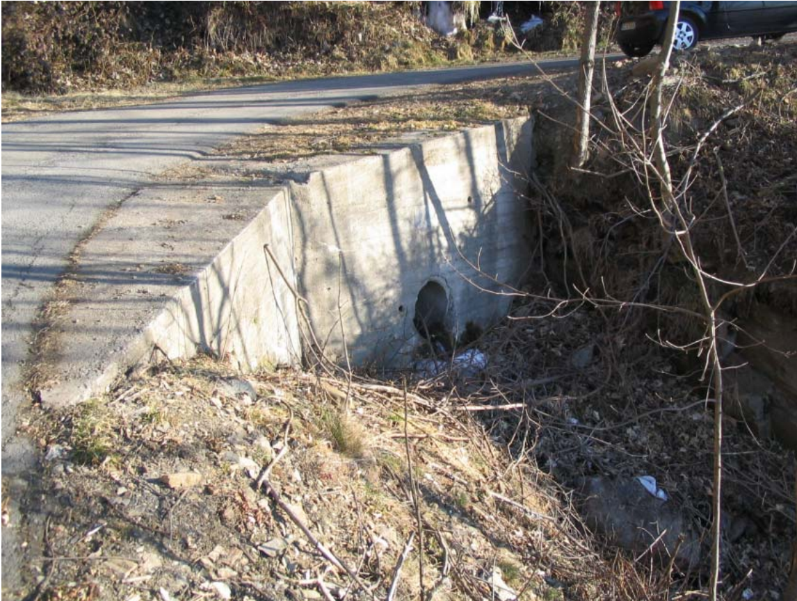
Foto 018 – Opera TREVAG018 . Ripresa da valle lungo la strada per frazione Ribetti.