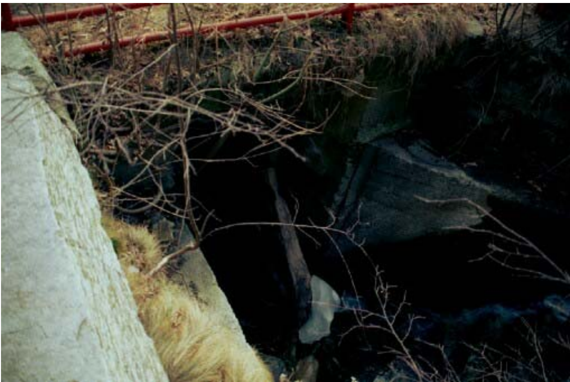
Foto 010 – Opera TREVAG010 . Ripresa da monte, da canalizzazione PENNCA001.