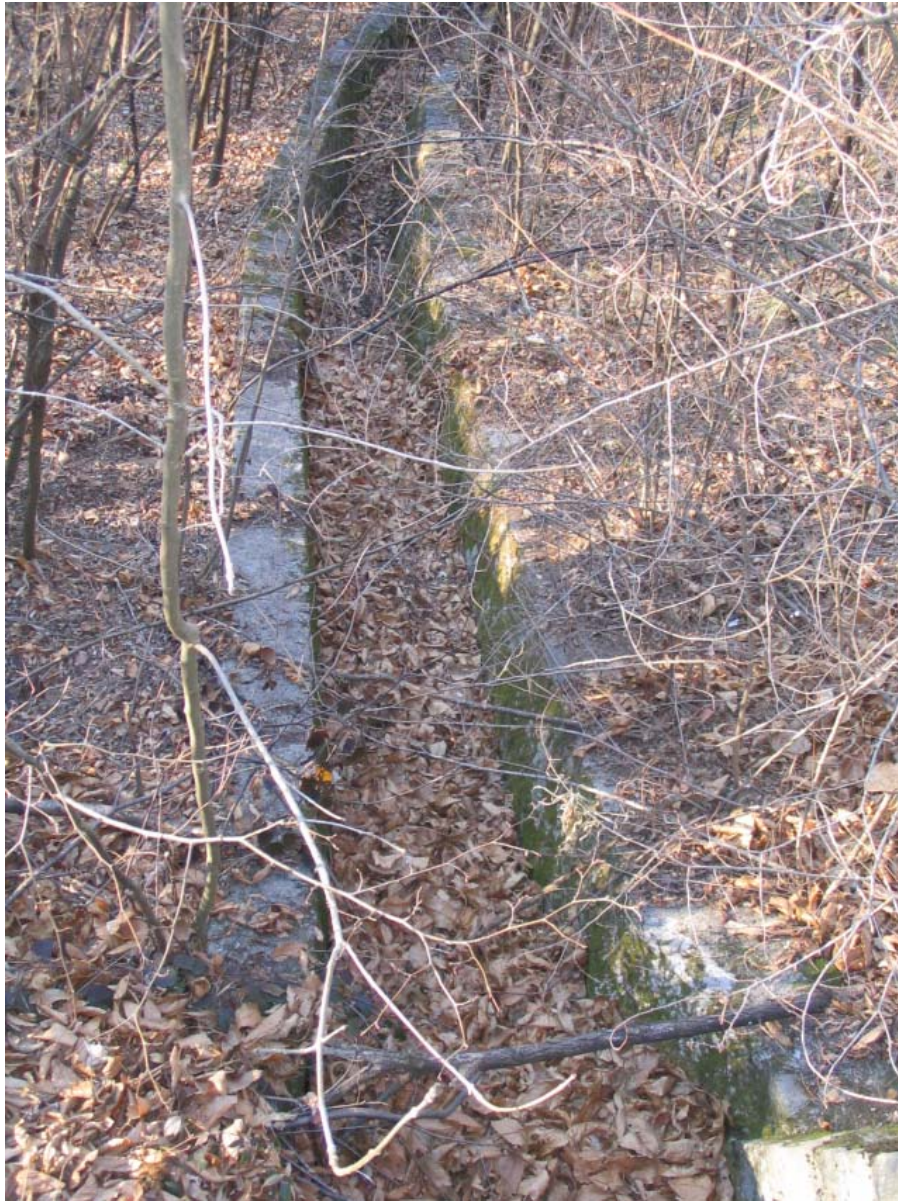
Foto 003 – Opera BATTCA003 . Ripresa da monte, dall'attraversamento PENNAG022.