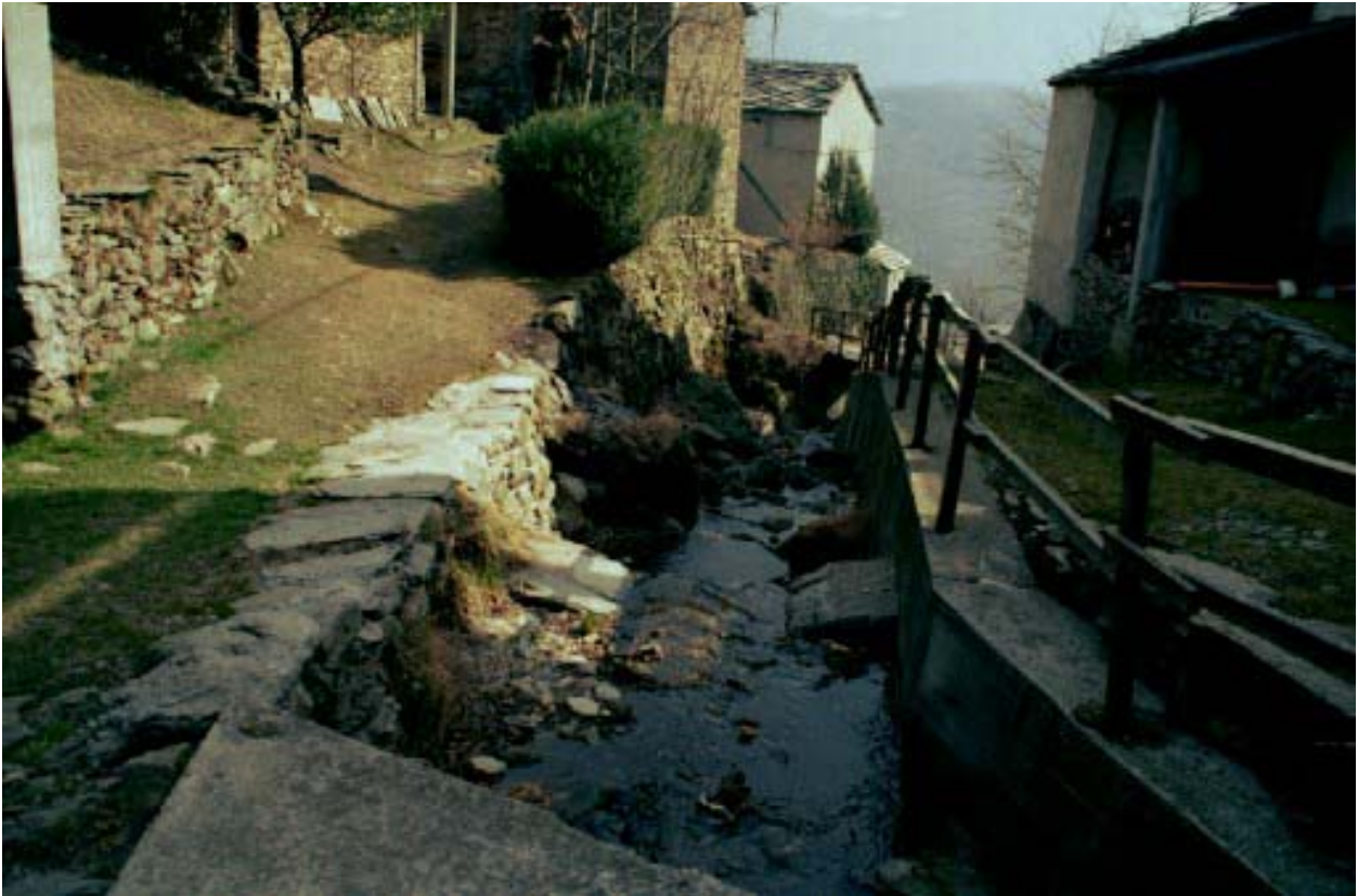
Foto 012 – Opera TREVDS012 . Ripresa da monte dall'attraversamento CANAAG013.