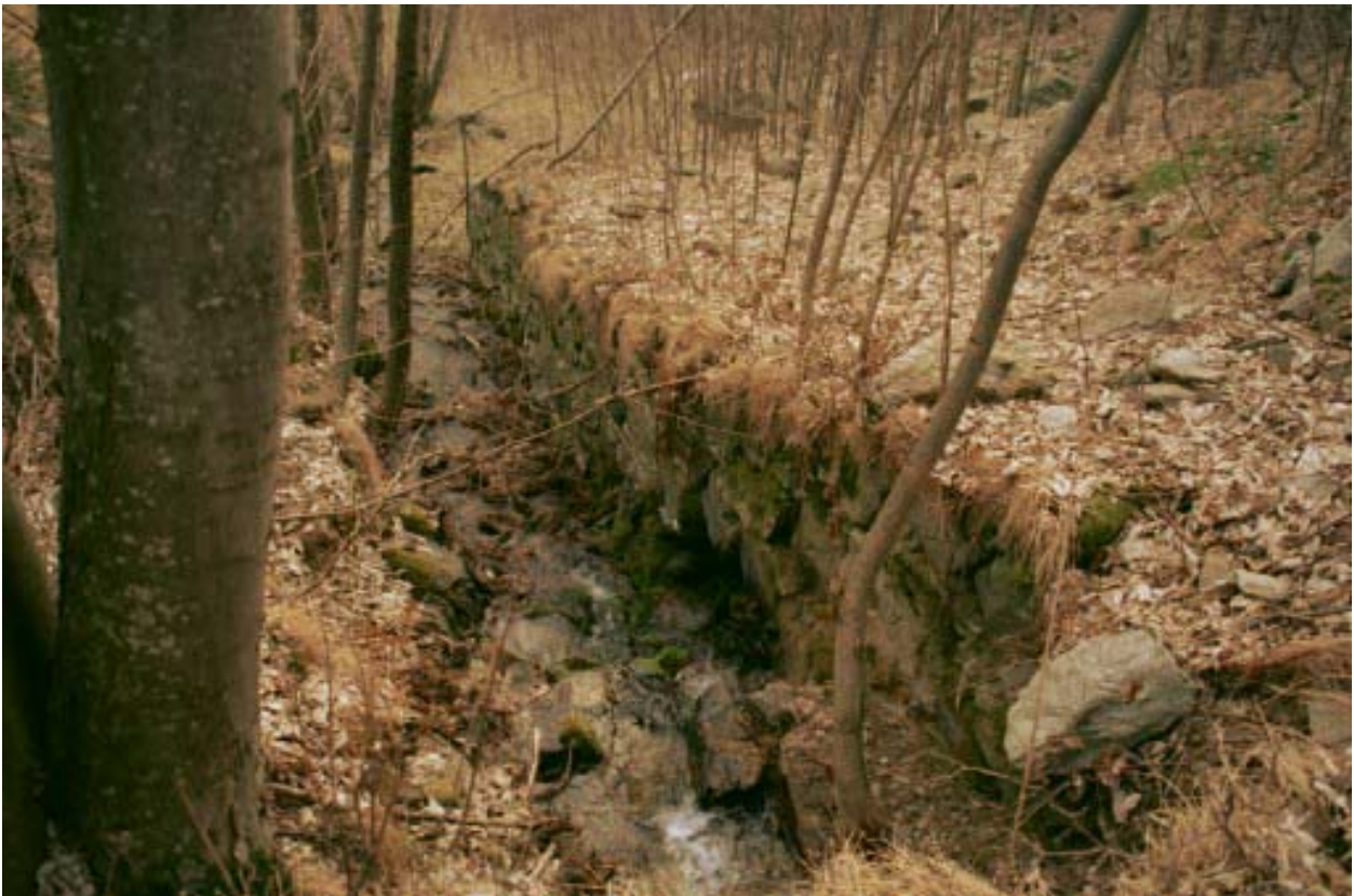
Foto 013 – Opera CANADS013 . Ripresa da monte, dall'attraversamento CANAAG021.