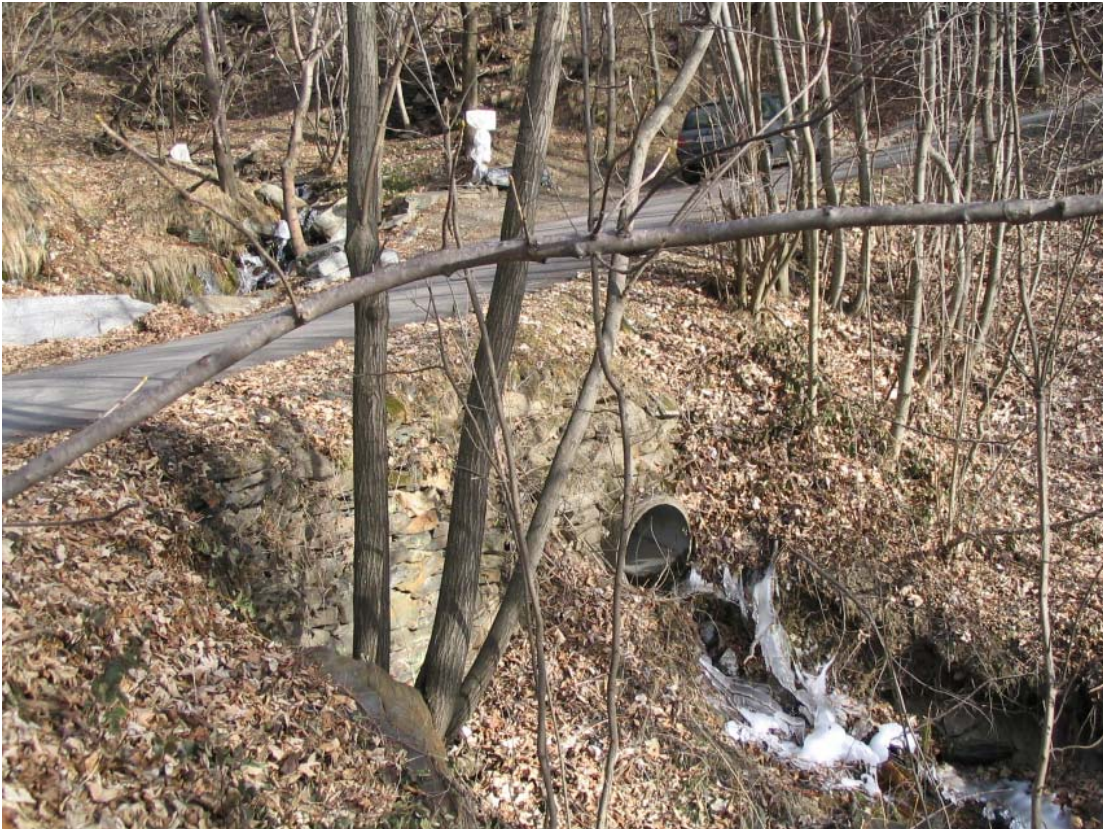
Foto 016 – Opera TREVAG016 . Ripresa da valle, lungo strada per B.ta Bosi.