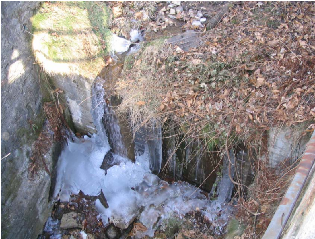
Foto 002 – Opera TREVBR002 . Ripresa da valle, dall'attraversamento CANAAG011.